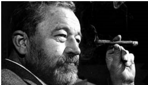
Toto je pan Jan Werich.