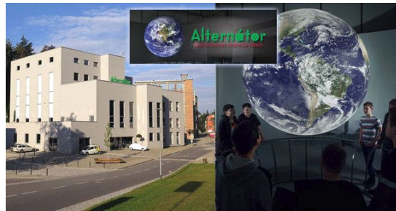
Toto je Alternátor.