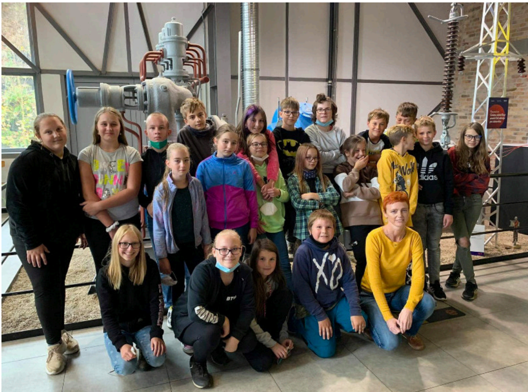
A to jsme my!